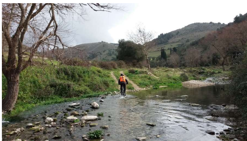
Guado sul torrente Gria

P.S. I partecipanti sono caldamente invitati ad evitare di usare durante le escursioni, bottiglie, bicchieri, piatti, e posate in plastica mono uso, optando per l'uso di materiali riutilizzabili.