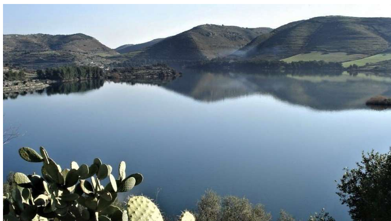
Lago S. Rosalia